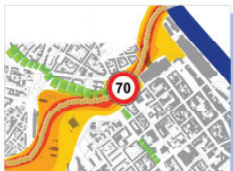
Relativ hohe Lärm- und Umweltbelastung