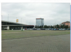
Untergenutzte Fläche Messplatz