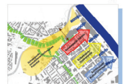
Positives Beispiel Stadtstraße