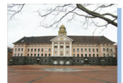
Neue offene Blickbeziehungen