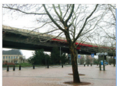
Barrierewirkung am Europaplatz