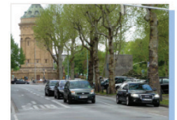
Möglicher Querschnitt Stadtstraße