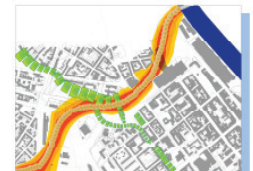
Geringere Belastung durch Lärmschutzmaßnahmen u. geringerem Flächenbedarf