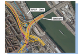
Brückenkopf Typ 1