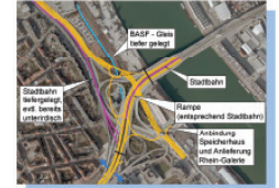
Brückenkopf Typ 2