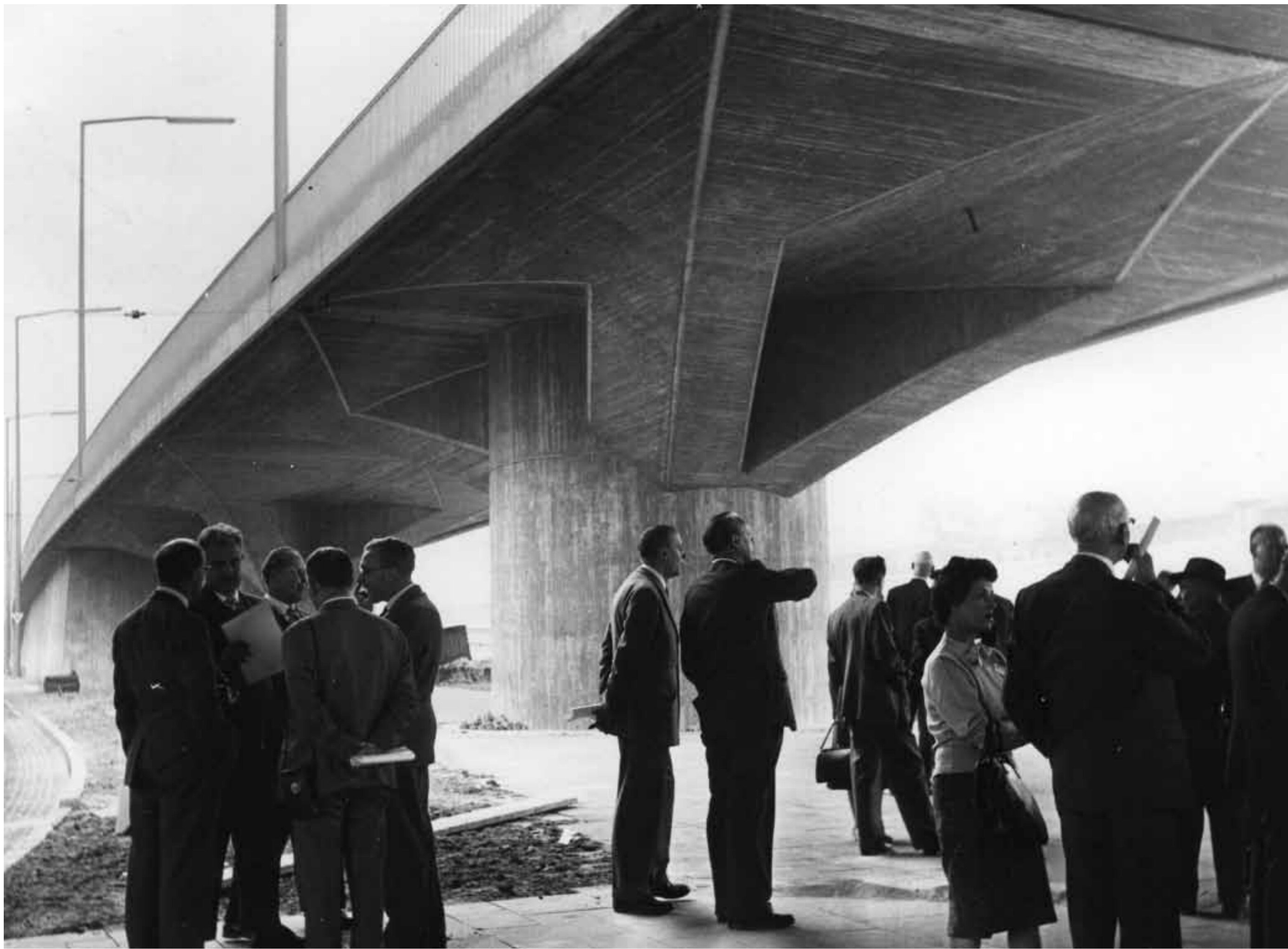
Britische Baufachleute besichtigen den Rheinbrückenkopf und die Hochstraße, 16.10.1959