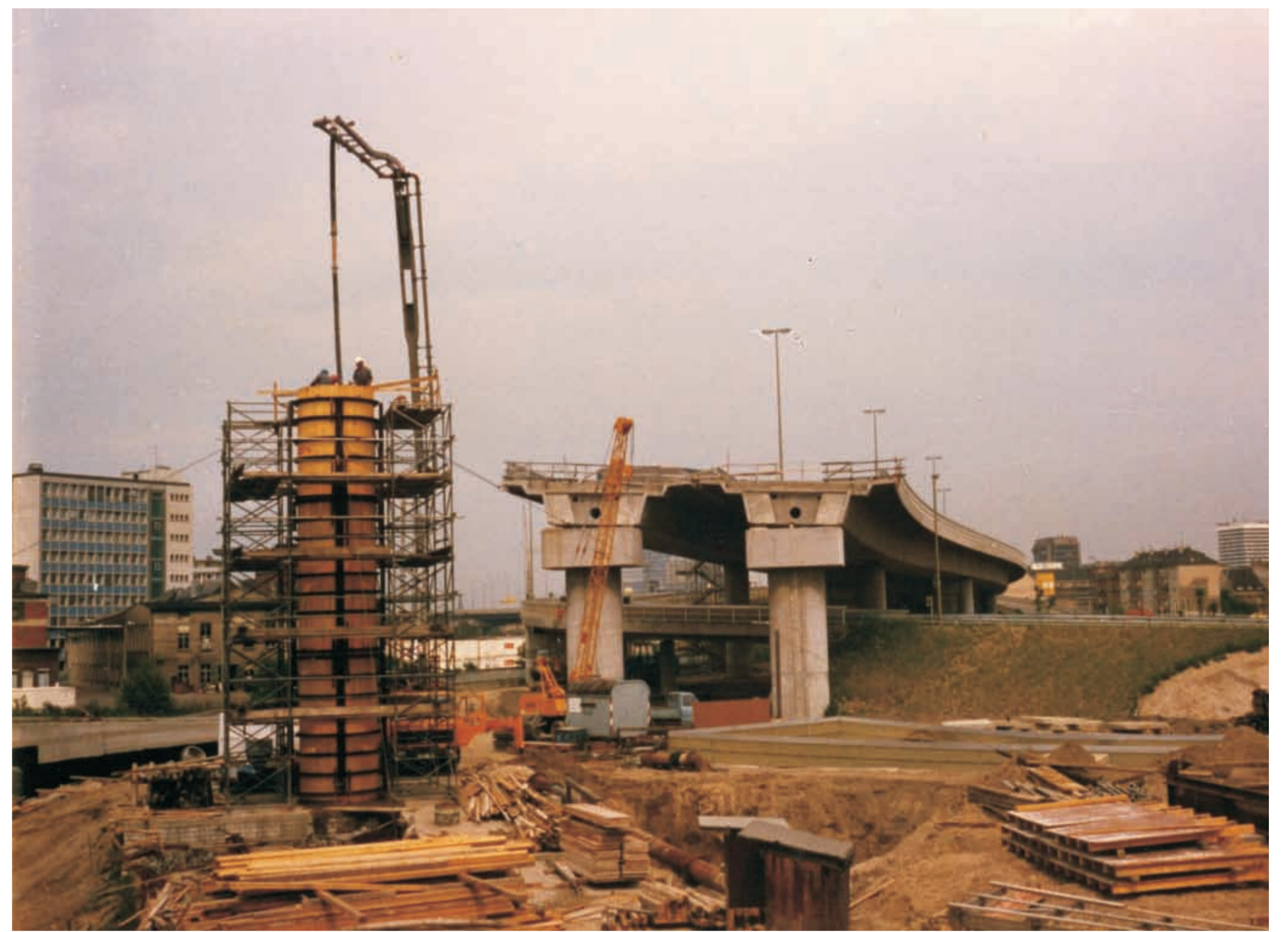
Bau der Hochstraße, Juni 1978