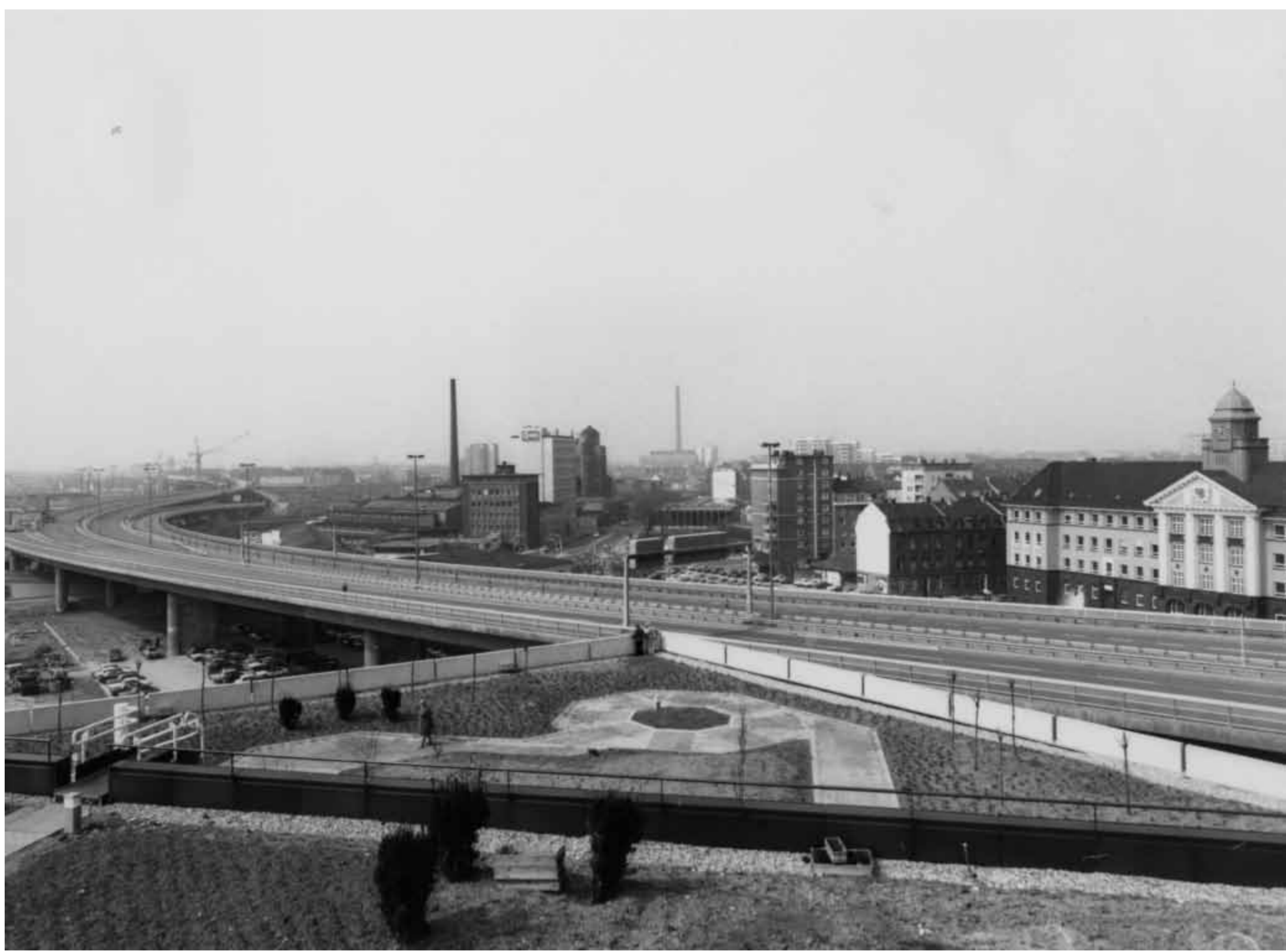
Hochstraße in Richtung Grünzweig-Knotenpunkt, 21.05.1979