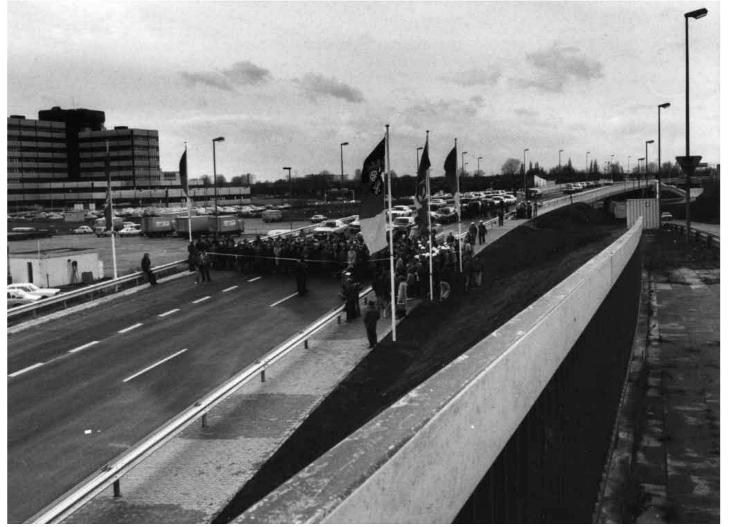
Übergabe eines Teilstücks der Hochstraße Nord in Höhe der Postbank und Paketpostamt (Bruchwiesenstraße), 10.12.1980